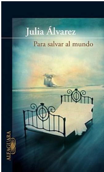
Julia Álvarez, "Para salvar al mundo", 2007