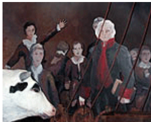
Exposición con ocasión del Bicentenario

La incorporación de la Rectora a la REFV se decide cuando los expedicionarios se encuentran en La Coruña ultimando los preparativos del viaje. Todavía en Madrid, el 21 de agosto de 1803, Balmis presenta una lista de los empleados, sus dotaciones y las asignaciones que dejan a sus familias. La Rectora no figura en ese documento. Desde la llegada a La Coruña a mediados de septiembre, Balmis se preocupa de fletar el barco y de coleccionar a los niños vacuníferos. Es entonces cuando entra en contacto con La Rectora de la Casa de Expósitos y probablemente decide incorporarla a la expedición. Se ha especulado sobre si la iniciativa pudo partir del propio Balmis, de la institución o de la misma Rectora. No se sabe con exactitud, pero dadas las atribuciones de que disponía Balmis, “la elección de los niños era tarea privativa del Director de la Expedición” o que excluyó de la lista inicial de expedicionarios pocos días antes de la partida al ayudante Ramón Fernández Ochoa por observar en él un mal comportamiento, no es de extrañar que la decisión partiera de él.