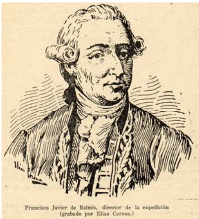
Francisco Xavier de Balmis