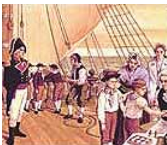
Niños durante el viaje