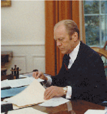
Gerald Ford, presidente USA (1974-1977)