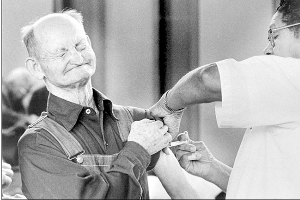
Vacunación en Watsonville (California)

Durante los 10 primeros días de octubre se vacunaron 1 millón de adultos en los estados que más activamente habían iniciado la campaña. Los niños quedaban todavía a la espera de resultados de los ensayos clínicos.