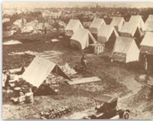
Base militar de Fort Dix (Nueva Jersey)

Para prevenir la transmisión de enfermedades respiratorias, los nuevos reclutas eran aislados en su compañía durante 2 semanas. El contacto con miembros de otros pelotones era escaso y nulo con los de otras compañías. A su llegada eran inmunizados contra la gripe, utilizando las cepas de la temporada 1975-76, A/Port Chalmers/1/73, A/Scotland/840/74 y B/Hong Kong/15/72. La vacunación antigripal, obligatoria para los soldados, fue también ofertada al personal civil y a las familias de los militares, que la aceptaron en un 40%. La reanudación de la actividad tras el paréntesis navideño, la afluencia de nuevos efectivos, las malas condiciones meteorológicas y una base al completo se asociaron para iniciar un brote explosivo de enfermedad febril respiratoria que comenzó el 5 de enero.