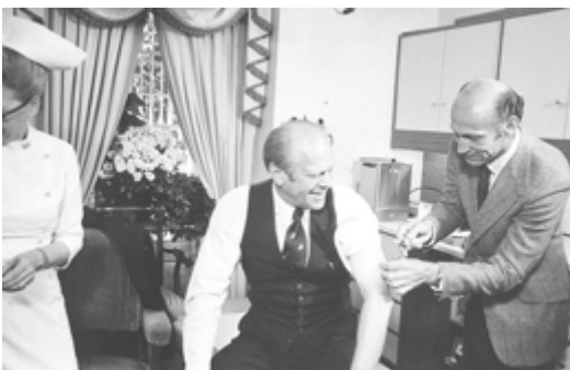
Vacunación del Presidente Ford