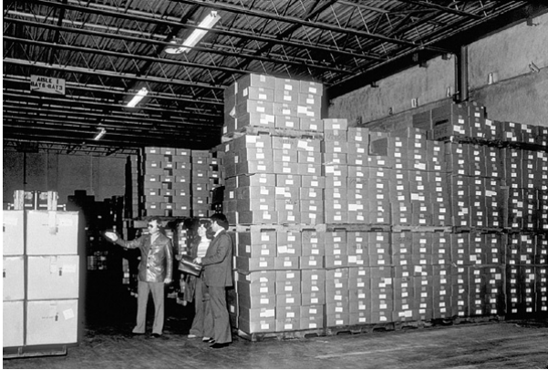
Almacenamiento de vacunas en un laboratorio

CDC elaboran una Guía para el Programa de Inmunización, que incluye el consentimiento informado, también han encargado la compra de 2000 inyectores a presión para la vacunación masiva 3 .