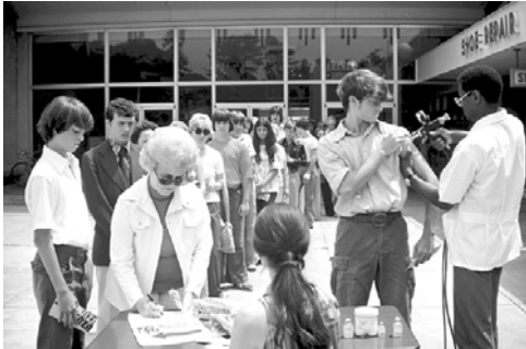
Sesión de vacunación escolar (1976)

La vacuna es inocente, pero solo en apariencia, algunos estados suspenden las inmunizaciones. Aún así, a mediados de diciembre más de 40 millones de americanos habían recibido la vacuna de la gripe del cerdo. La distribución por estados fue desigual, unos alcanzaron el 80% de cobertura, otros no llegaron al 10%. Según el informe Neustadt, dadas las dificultades que atravesó el programa debe considerarse como un éxito 3 .