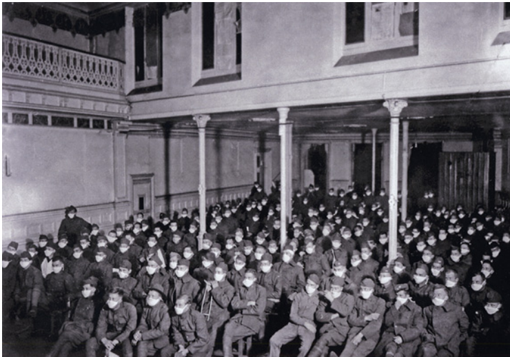
Hospital del ejército americano en Francia durante la gripe de 1918

A estas evidencias epidemiológicas se añadían las teóricas. Un artículo publicado en el New York Times el mismo 13 de febrero contribuyó a alimentar las preocupaciones. Su autor era Edwin Kilbourne un reputado especialista en gripe. En su texto de contenido perturbador, enunciaba que las pandemias ocurren en ciclos de 10 u 11 años de duración, periodo que posibilita las variaciones antigénicas, este “cambio o sustitución” estaba a punto de producirse, tal como ocurrió en 1946, 1957 y 1968. Urgía a las autoridades de salud pública a elaborar un plan para evitar un “inminente desastre nacional” que situaba en 1979 3,6 . Lo expresó de manera muy gráfica: “¡Gripe a estribor! ¡Preparad los arpones! ¡Llenadlos con vacuna! ¡Avisad al capitán! ¡Rápido!” 2 . Kilbourne, que trabajaba en el Hospital Monte Sinaí de Nueva York, conocía por una llamada telefónica de Goldfield que éste tenía en New Jersey un virus que no había conseguido tipar y le pidió que le remitiese muestras.