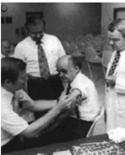
Figura 4. Hilleman recibiendo una vacuna experimental (Nat Med, 1998)

El interés de Hilleman por todo lo concerniente a la vacunología se muestra claramente en toda su producción científica. A las actualizaciones sobre las vacunas que había investigado personalmente (9-42), podemos añadir sus consideraciones sobre aspectos éticos en la experimentación (50), la cooperación inter-agencial (51), las armas biológicas y el bioterrorismo (52), la investigación aplicada en inmunología (53), el papel de la industria farmacéutica (54), las vacunas futuras (9,10,11,15,16,19,22). Mostró su preocupación por la cadena de frío vacunal "mantener el producto a bajas temperaturas desde el momento de su preparación hasta el momento en que es administrado al paciente" (56), siendo un pionero en la búsqueda de vacunas termoestables (55,56) y señalando "parece crítico para la OMS y el EPI sopesar el coste que supone mejorar algunas vacunas frente a los costes para establecer una efectiva cadena de frío. Ahora lo que importa es asegurar un efectivo transporte de vacunas" (56).