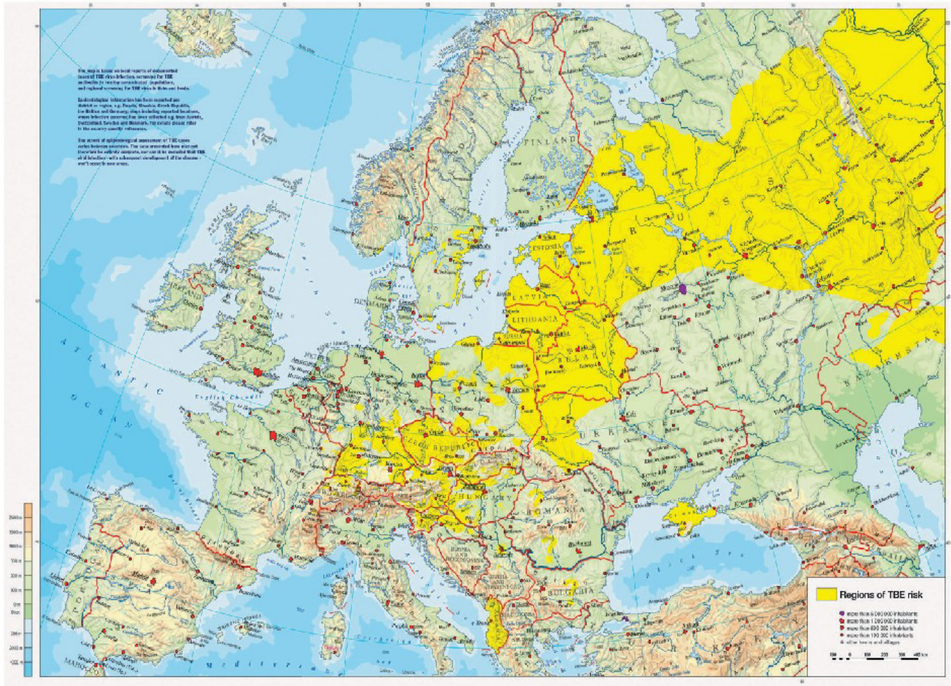
Figura 3. Regiones endémicas de encefalitis centroeuropea en el cinturón forestal euroasiático 4

hasta Japón. Los continentes americano y australiano no presentan virus TBE.